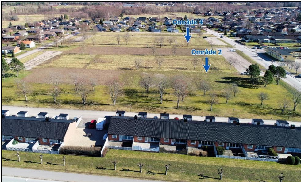
Flygfoto över kvarteret Ugglan.