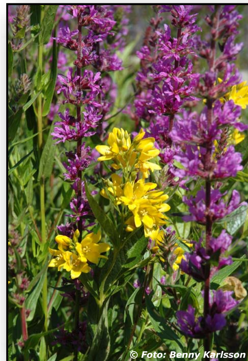
Fackelblomster och strandlysing