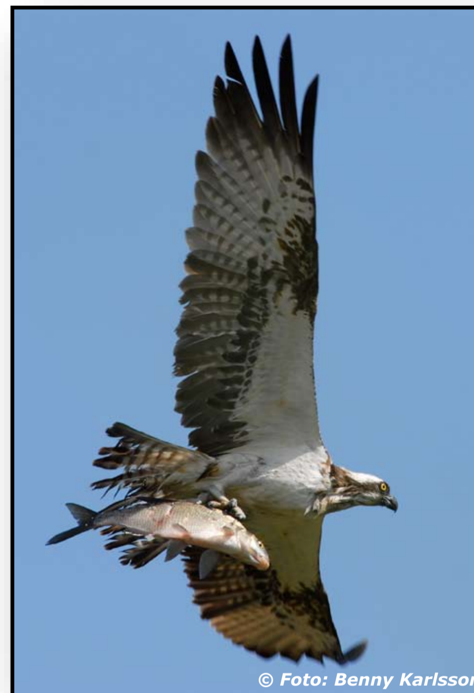
Fiskgjuse med fångad fisk

Syftet med reservatet är att bevara områdets rika fågelliv genom bl a vasslätter i åmyningen samt sköta området så fåglar, växter, groddjur och ormar kan trivas. Kommunens förhoppning är att fler ska upptäcka detta fina område!