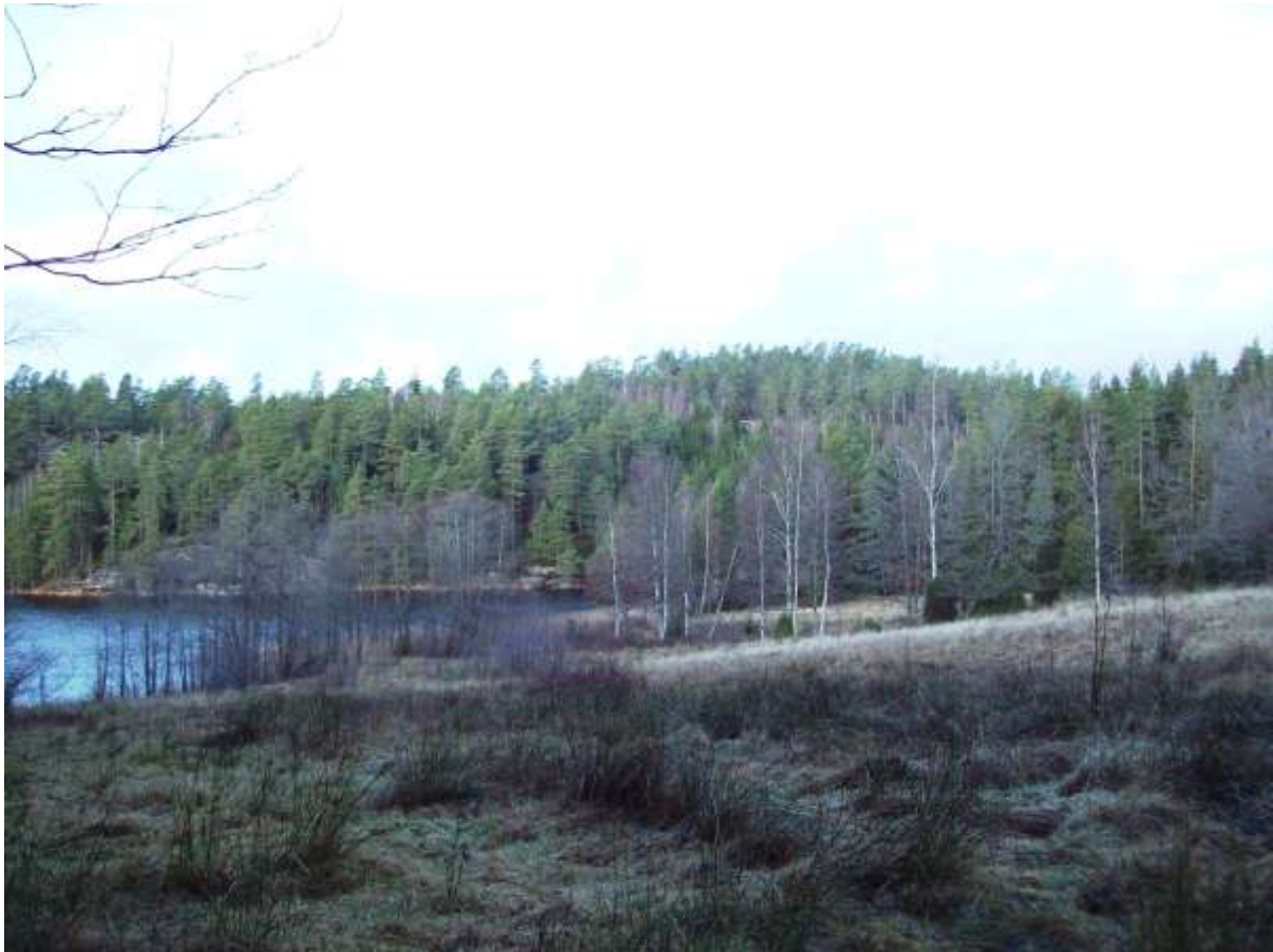
Utsikt över strandskyddsområdet vid Båttjärnet.

Samma idéer om bebyggelsens utformning om att ordna stugor i grupper med karaktär av gamla tiders gårdstun emellan och omgivna av restaurerad öppen kulturmark, som framfördes i programbeskrivningarna för vissa områden i Livarebo, föreslås i detta område. Det aktuella området är omkring 4 ha, varav 2 ha ligger inom strandskyddat område, som kommer att undantas från nybebyggelse för bostadsändamål och vara tillgänglig för det rörliga friluftslivet.