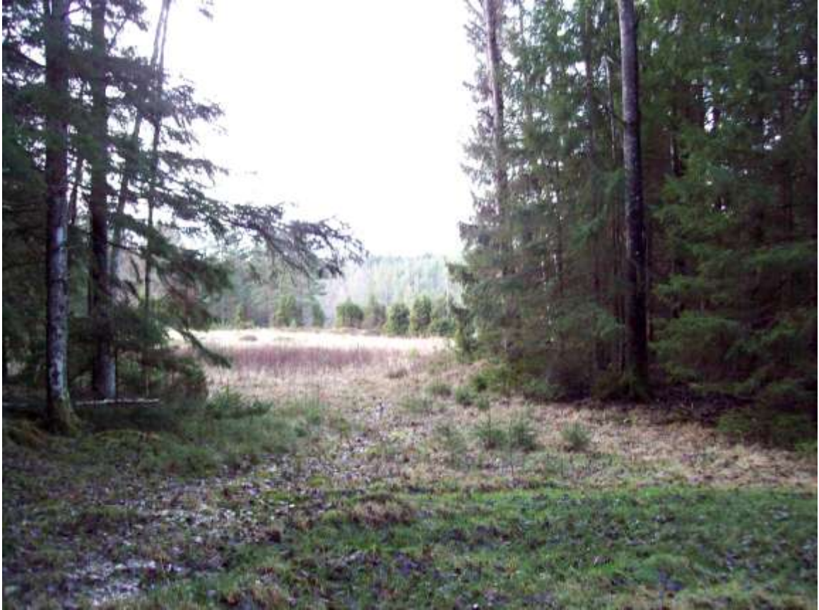
Entrén till området.